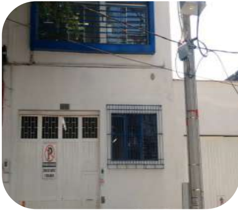
Sede operativa de Medellín, ubicada en el sector San Diego