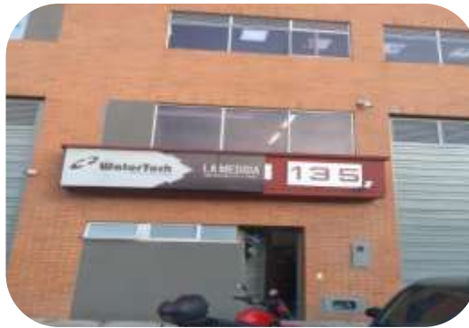
Sede operativa de Bogotá, ubicada en el municipio de Cota.