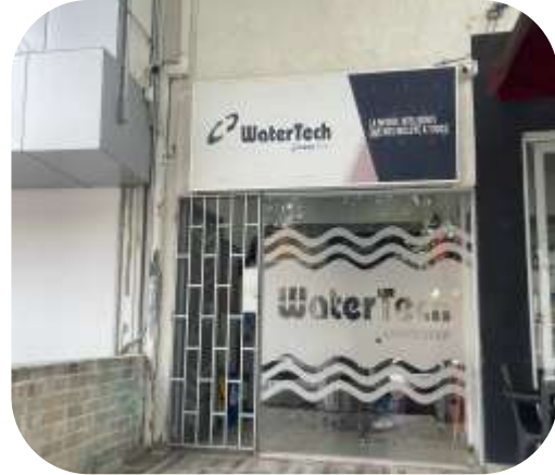
Nuestro punto de venta en la ciudad de cali, ubicado en el barrio San Vicente